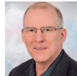
Harald Fritzsche Microdul AG