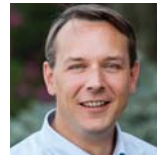
Sebastian Schlegel Technische Beratung Verbindungstechnik